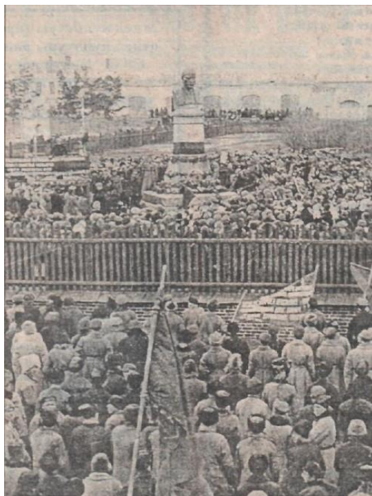
Торжественное открытие памятника В.И. Ленину в Троицке 7 ноября 1924 года.

конуса, с пятью поясами разной высоты, был украшен царской символикой. При установке бюста Ленину, конечно, царская символика была сбита, а сам бюст при установке был развернут на 180 градусов и обращен в сторону администрации г. Троицка. На постаменте высечена надпись «Ленин. 1870–1924 год».